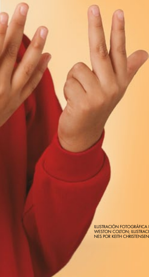
ILUSTRACIÓN FOTOGRÁFICA POR WESTON COLTON; ILUSTRACIONES POR KEITH CHRISTENSEN

3 Cuando ores, asegúrate de agradecer al Padre Celestial las cosas buenas que recordaste. ¡También puedes contarles a los miembros de tu familia las bendiciones que encontraste!